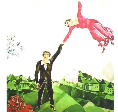
Marc Chagall "Spaziergang"